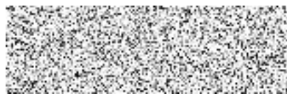
Jiří Beran Zhotovitel