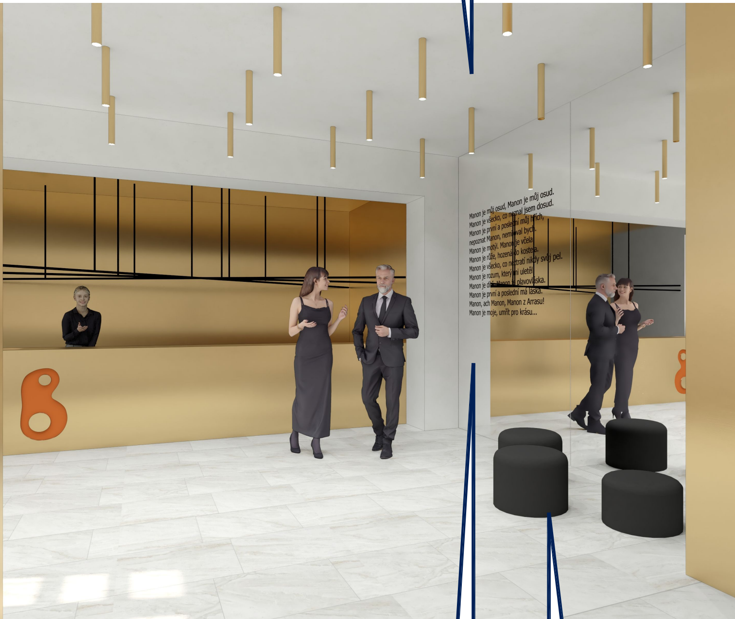
ZRCADLOVÁ STĚNA S MOTIVEM POEZIE