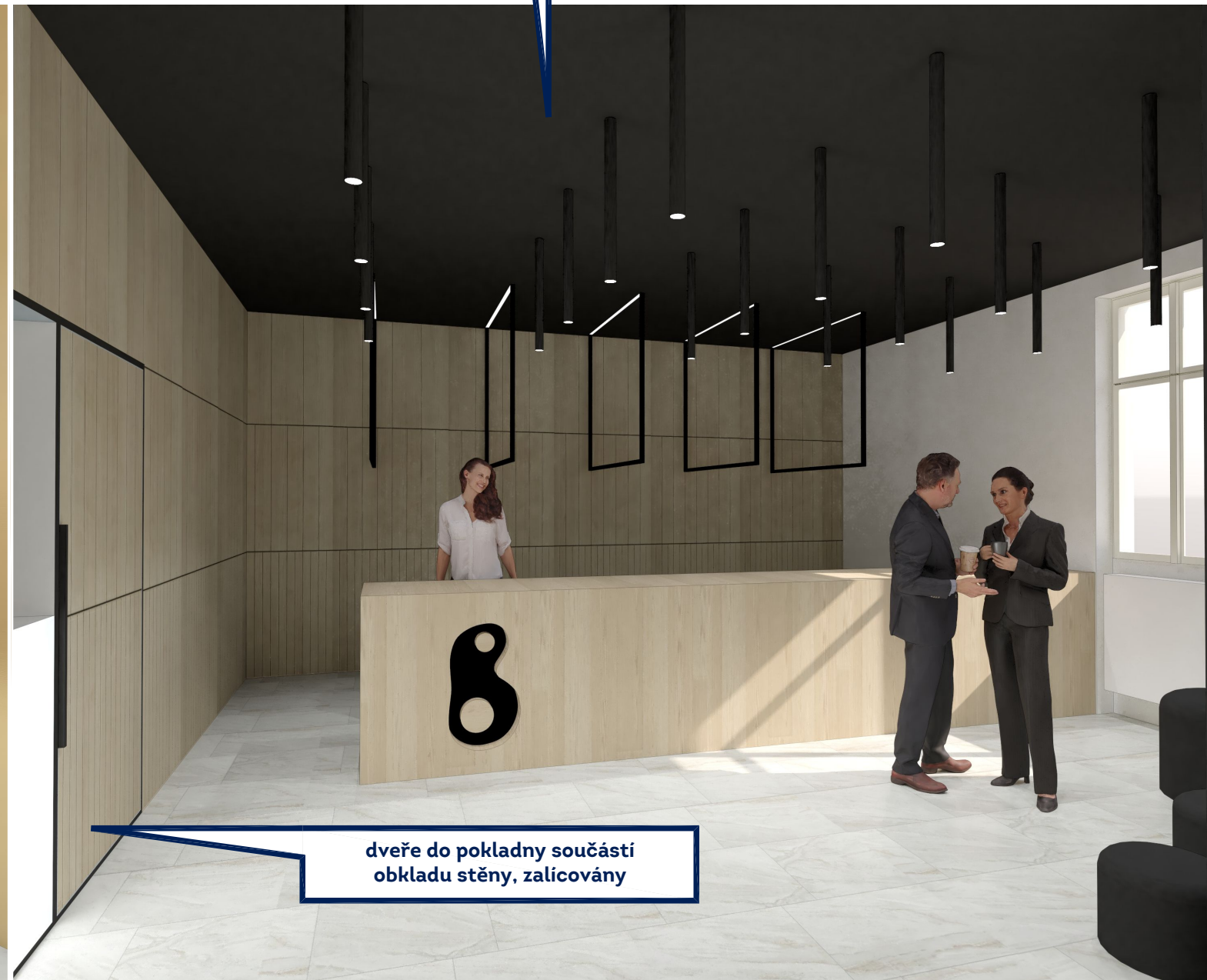
dveře do pokladny součástí obkladu stěny, zalicovány